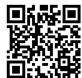
連絡メール2 保護者ログイン

学校・お子様の追加やその他登録内容を変更する場合 右記の「保護者ログイン用二次元コード」を読み取り、保護者サイトに接続します。 * その際、登録したメールアドレスとログインパスワードを入力します。 * 保護者サイト https://renraku.education.ne.jp/parent/ パスワードを忘れた場合 上記登録と同様に空メールを送信すると、パスワードの再設定ができます。 * 保護者登録しているメールアドレスがご利用できない場合は、パスワードの再設定ができません。