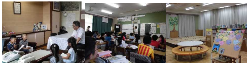
11年生 校長先生にバザー 学校訪問授業

七小の図書室には、1万5000冊を超える蔵書があります。また各教室には学級文庫もあります。机やランドセルの中に本が入っていて、ちょっとした時間にも本を手にする児童が増えていくと良いです。