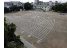
←体力テストのライン