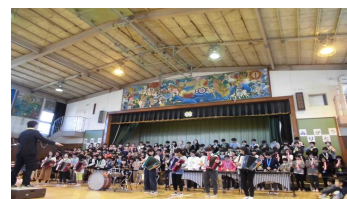
【 6年生を送る会 】

この一年、PTA役員の皆様をはじめ保護者・地域の皆様には本校の教育活動に対し、深いご理解とご協力を賜り、職員一同、感謝の気持ちでいっぱいです。次年度も、地域の学校としてお子様の母校として一層ご支援ご協力くださいますようよろしくお願い申し上げます、今年度の最終号といたします。