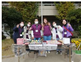
ふれあいフェスティバルの様子