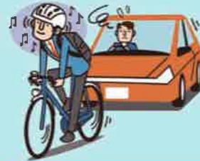
イヤホン等使用運転