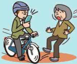
スマホ等使用運転